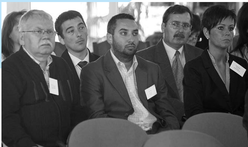
A rendes évi közgyűlésen a tulajdonos önkormányzatok képviselői elfogadták a múlt évi üzleti terv teljesítéséről szóló beszámolót, és az idei tervet is