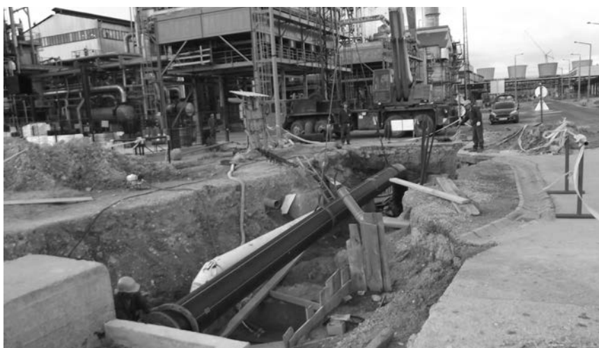
Szakmai kihívást jelentett a vezetékelújítás a Péti Nitrogénművek területén