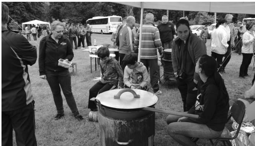
A közös főzés örömeivel gazdagodott az idei Családi Nap programja