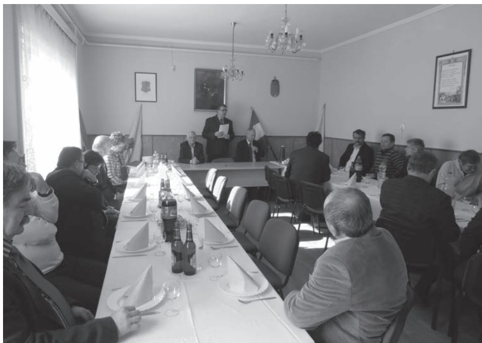
Ünnepi pillanat volt Kertán a művek átadása

A települések Marcalvölgye Ivóvízminőség Javító Önkormányzati Társulás néven Kerta gesztorságával pályáztak a beruházás támogatásáért. Az adorjánházai, kertai, valamint az Egyházaskesző-várkeszői rendszer ivóvízhálózatában másodlagos vízminőség romlásból eredő, időszakosan előforduló határérték feletti nitrit tartalom miatt új vas-, mangán- és ammónia mentesítő