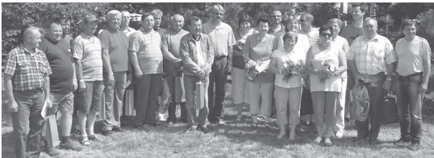
A nagyvázsonyi családi napon elismerésben részesültek a kerek évfordulós törzsgárda tagok és „A BAKONYKARSZTÉRT” érdemérem idei kitüntetettjei, valamint elbúcsúztatták a nyugdíjba vonulókat. Képünkön az ünnepeltek népes csoportja