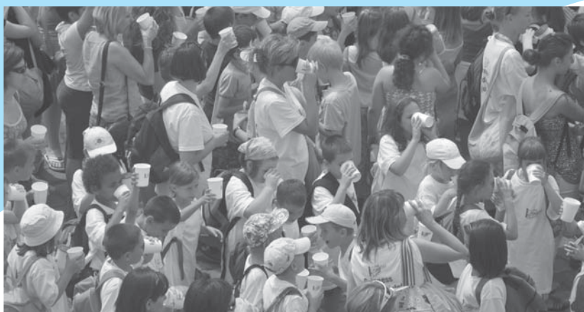
Veszprémbe sok ezren ittak csapvizet egy időben, hogy bekerüljenek a Guinness Rekordok Könyvébe