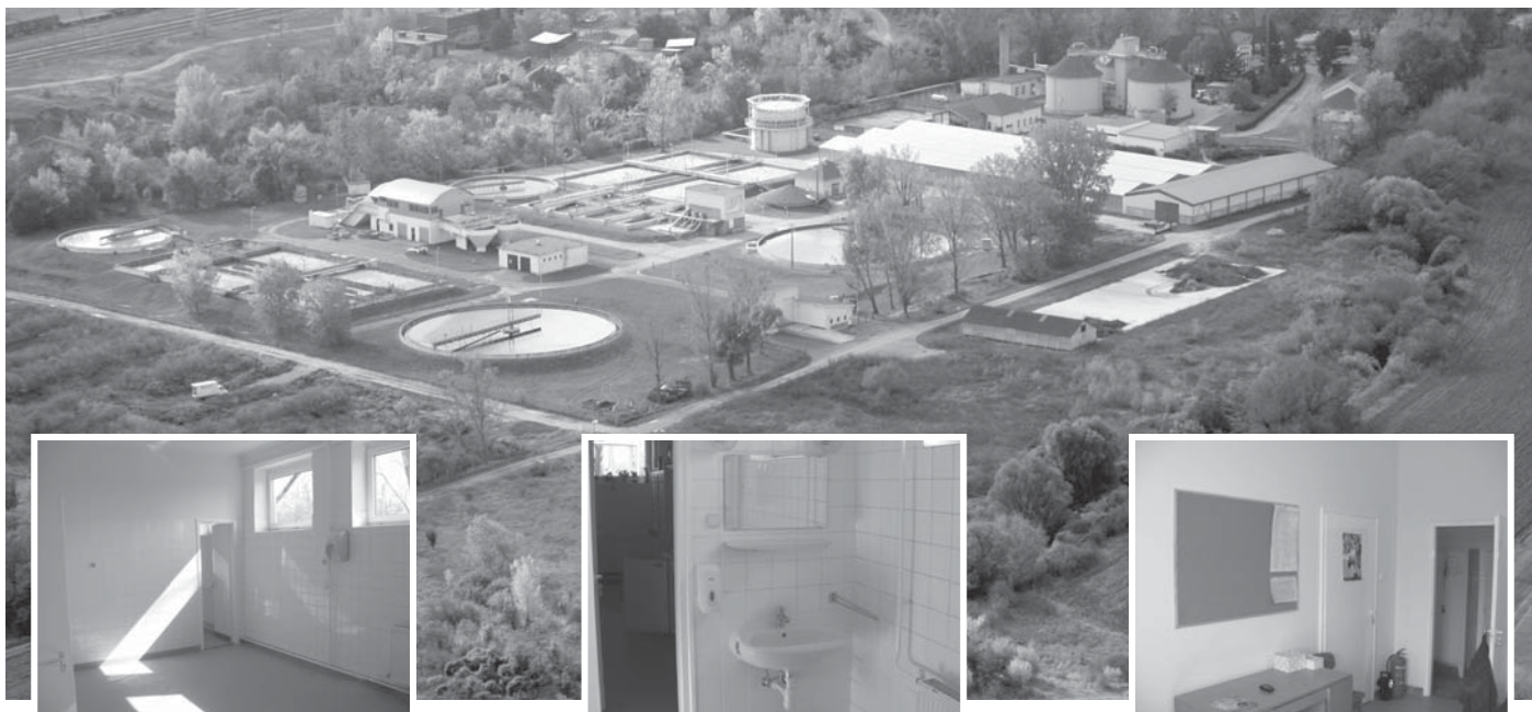
A Veszprémi Szennyvíztisztító Telep felújítása során megújultak az üzemviteli épület szociális helyiségei is