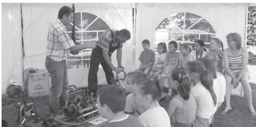
Mezőlakon a nyílt napon a helyi és környékbeli kisdiákok ismerkedtek a vízszolgáltatás eszközeivel