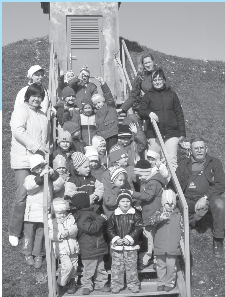
Várpalotai óvodások egy csoportja látogatott el a Széltető-medencéhez, a Víz Világnapja alkalmából