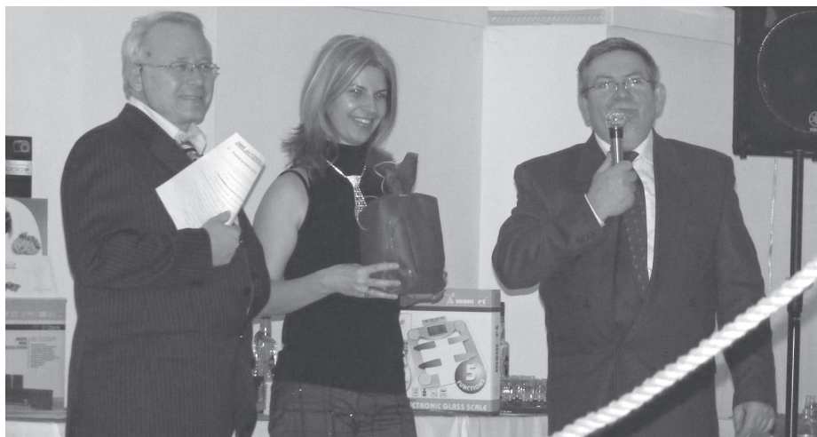
Tombolasorsolás..., de nem a fődíj nyertesével

Én is vásároltam becsülettel. És bizony, ki mint vet, úgy arat, meg is nyertem a fődíjat. Azt hogy ennek mindenki osztatlanul örült-e nem tudom, de amikor kimentem érte a dobogóra, a többiek valamilyen télika-