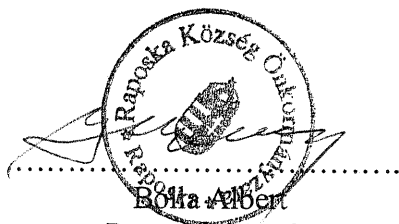
Bólya Albert Raposka Község Önkormányzata

BAKONYKARSZT Zrt. 8200 VESZPRÉM, PÁPAI U. 41.