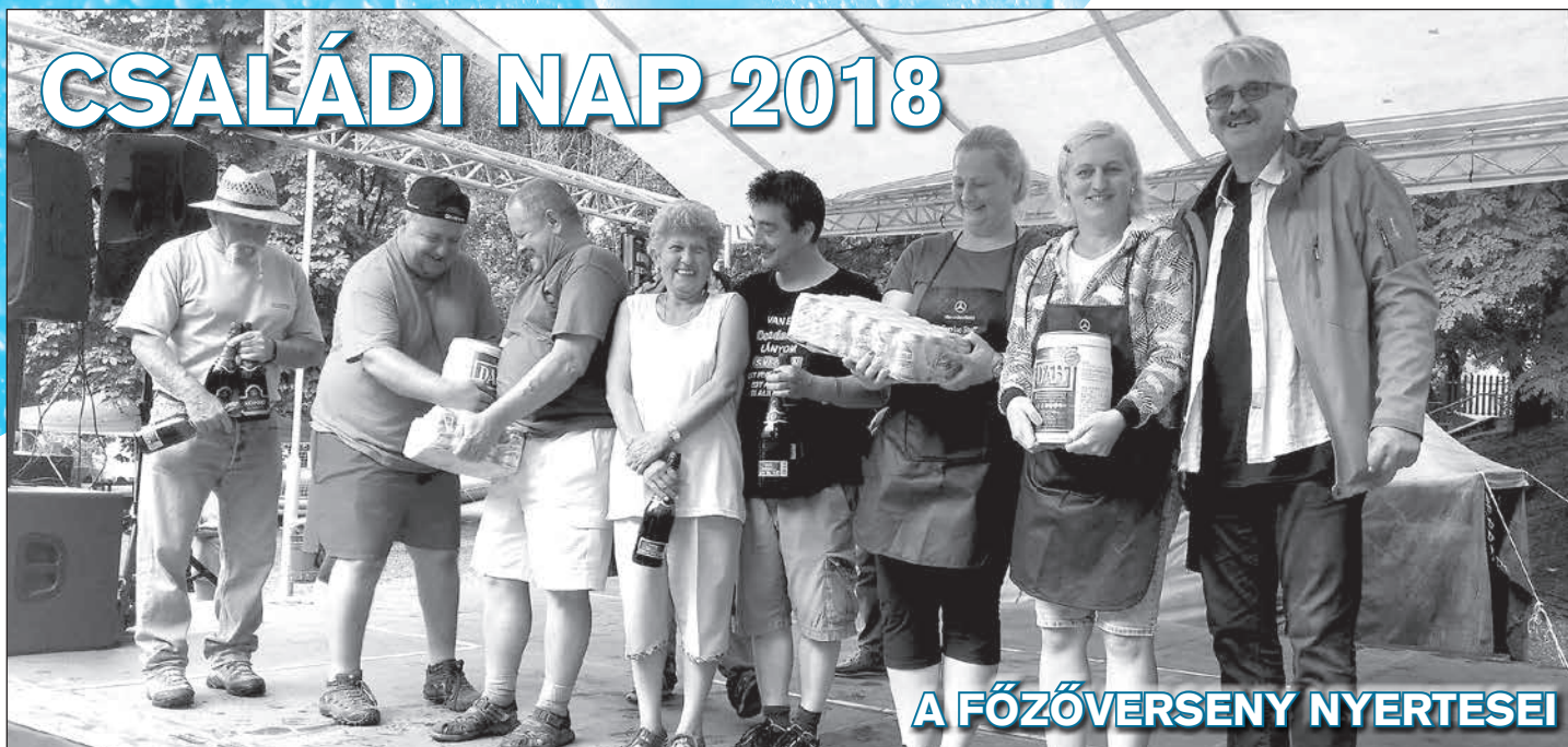
A FŐZŐVERSENY NYERTESEI