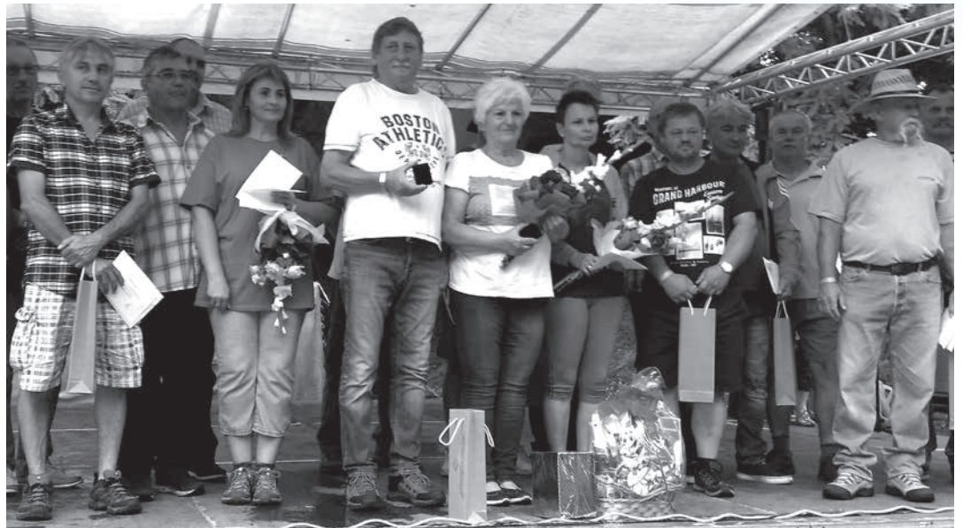
A „BAKONYKARSZTÉRT érdemérem” díjazottjai és a törzsgárda tagok

A rendezvényhez a liget alkalmasnak bizonyult, viszont az időjárás már nem annyira. A napot megelőző éjszaka vihara nemcsak a palotai kollégák szorgos előkészületi munkájában tett kárt – összedöntött egy sátrat, kettőnek meg felhasadt a ponyvája –, hanem jó néhány víz-műves családot riasztott vissza. Előzetesen ugyanis 613 fő jelentkezését regisztrálták a rendezők, szombaton délelőtt viszont 410 karszalagot osztottak ki a beléptetéskor. Az időjárás még ekkor sem döntött arról, hogy a báraknak kedvezzen, mert a 10 óra tájban, a „hivatalos” programokkal – vezérigazgatói köszöntő, a különböző „évjáratú” törzsgárda tagok jutalmazása, a „BAKONYKARSZTÉRT érdemérem” átadása – nem csak a családi nap kezdődött el, hanem az eső is megereedt. A színpadon zajló eseményeket komolyabban nem zavarta meg az órákon át tartó bő csapadék. Legfeljebb annyiban, hogy a közönség távolabb-