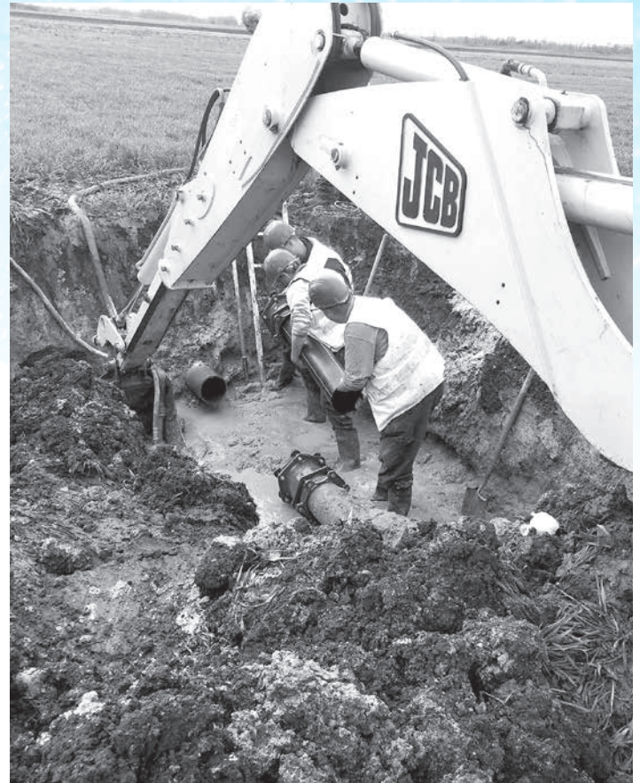
A hibaelhárítás az egyik leggyakoribb feladat

Az anyagi jellegű ráfordítások 4,8 százalékkal csökkentek, bérleti díjakból kevesebbet fizetünk majd ebben az évben. A villamos és egyéb energiánál kb. 14,5 százalék növekedés várható. Emelkedett az áramdíj, a rendszerhasználati díjak csökken-