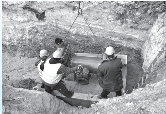
A teljesítésben jelentős szerepet játszott a Várpalotát elkerülő főúttal kapcsolatos ivóvízvezeték közműkiváltása

A 2017. évi üzleti terv teljesítéséről szóló írásos beszámoló részletesen leírja a gazdasági adatokat, melyből szóbeli kiegészítőjében a vezérigazgató azt emelte ki, hogy az üzemi ráfordítások 0,6 százalékos túllépésével szemben az üzemi bevételnél 3,7 százalékos növekedés mutatkozik, így az adózás előtti eredmény nem éri el a 2016-os év veszteségének 25,0 százalékát. Jelezte, hogy az anyagi jellegű ráfordításoknál a tervhez képest 3,9 százalékos túllépés a többletfenntartásnak köszönhető. A személyi jellegű ráfordításnál pedig a cégvezetés élt a közgyűlési felhatalmazással, hogy 10 százalék erejéig túlléphesse a tervszámot, melynek eredményeként 10,3 százalékos bérnövekedést tudott elérni a tavalyi évben. Hozzátette: „mi nem kaptunk olyan lehetőséget, mint az állami tulajdonú szolgáltatók, hogy 3 év alatt 30 százalékos bérnövekedést tudjanak végrehajtani állami támogatásból. Nekünk ezt saját erőnkől kell „kiizzadni”. Szóbeli kiegészítőjének befejezéseként megköszönte a részvénytársaság tulajdonosainak az elmúlt év eredményesnek értékelhető