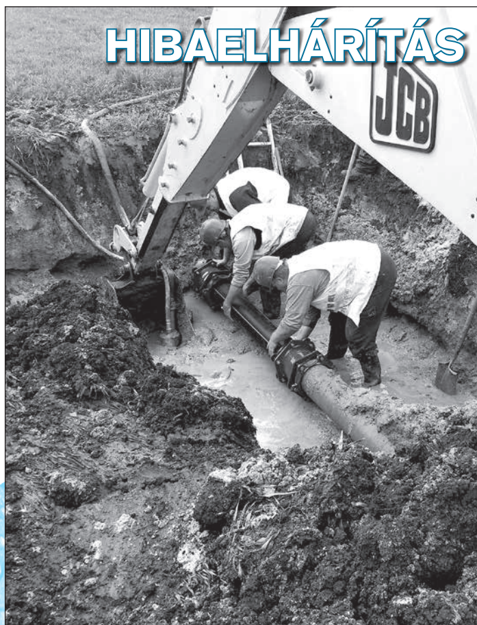
„Küzdelem” a nagyacsádi tavaszban