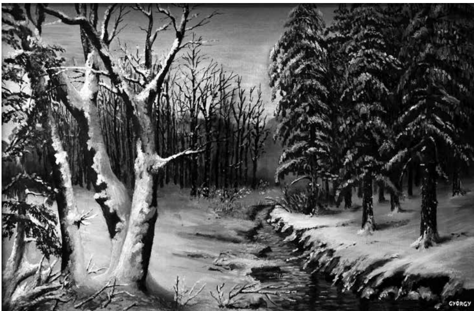
György Ferenc többnyire a bakonyi tájat örökíti meg festményein