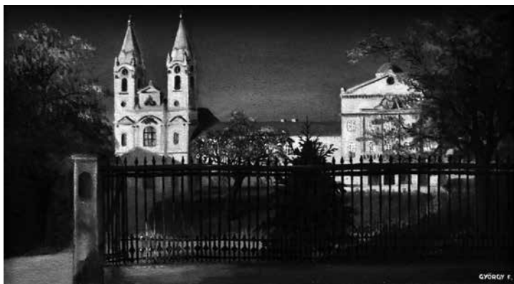
A Zirci apátság épületegyüttesét is megörökítette festményén György Ferenc amatőr festőművész, a vízmű nyugdíjasa