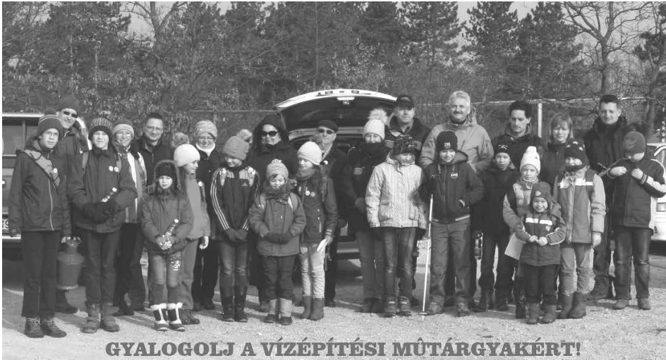
GYALOGOLJ A VÍZÉPÍTÉSI MŰTÁRGYAKÉRT!

Ha a címet kell pontosan elemezni megmosolyogtató eredményre juthatunk. Nem tűnik igazán nehéz feladatnak „követni” egy nagy vasbeton építményt. De ha a szavak jelentése mögé próbálunk betekinteni, meghökkentő eredményre juthatunk. Nap, mint nap megyünk el azok mellett az építmények mellett, melyek több évtizede szolgálnak ki minket egészséges ivóvízzel, óvják meg környezetünket az ártalmaktól és vigyáznak épített értékeinkre.