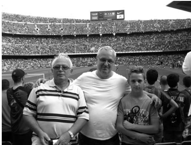
Az FC Barcelona szentélyében

Nyaralásunk második napján izgatottan indultunk az eddig még ismeretlen Barcelona felé. A közel százezres komplexumba, a Camp Nou-ba gyorsan megy a beléptetés. Belül pedig színek kavalkádja, forró léghő fogadja az idegent. Hátborzongató, ahogy a százezer ember elénekei a Barca himnuszát, ami itt a Katalán életérzés megtestesítője, hiszen a csapat a függetlenségi törekvések szimbóluma, amellyel hogy itt mindent átítat a foci