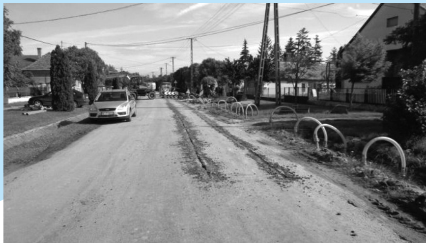
Zalagyömörő térségében épült új szennyvízhálózat több szakaszán vákuumos talajvízszint süllyesztést alkalmaztak