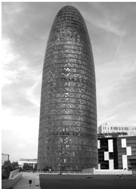
Barcelonai vízmű székháza