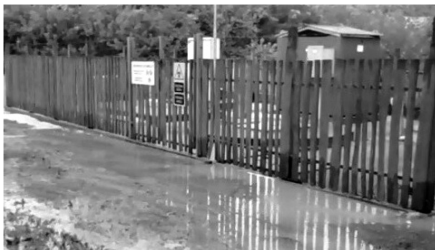
A BAKONYKARSZT Zrt. működési területén több vízfolyás áradt ki a sok csapadék hatására. Így az Eger-völgyben is, Kapolcson.