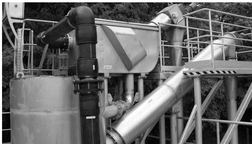
Megújult a Dudari Szennyvíztisztító Telep