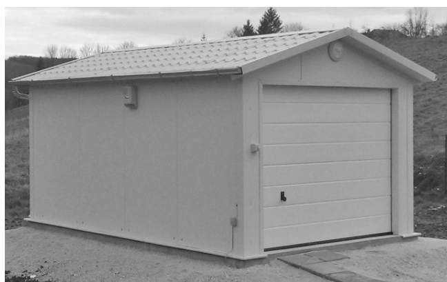
...és az új kezelőépület