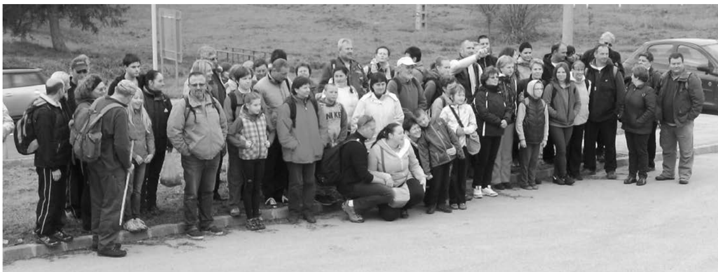
A túra kezdetén, amikor még senki sem volt fáradt