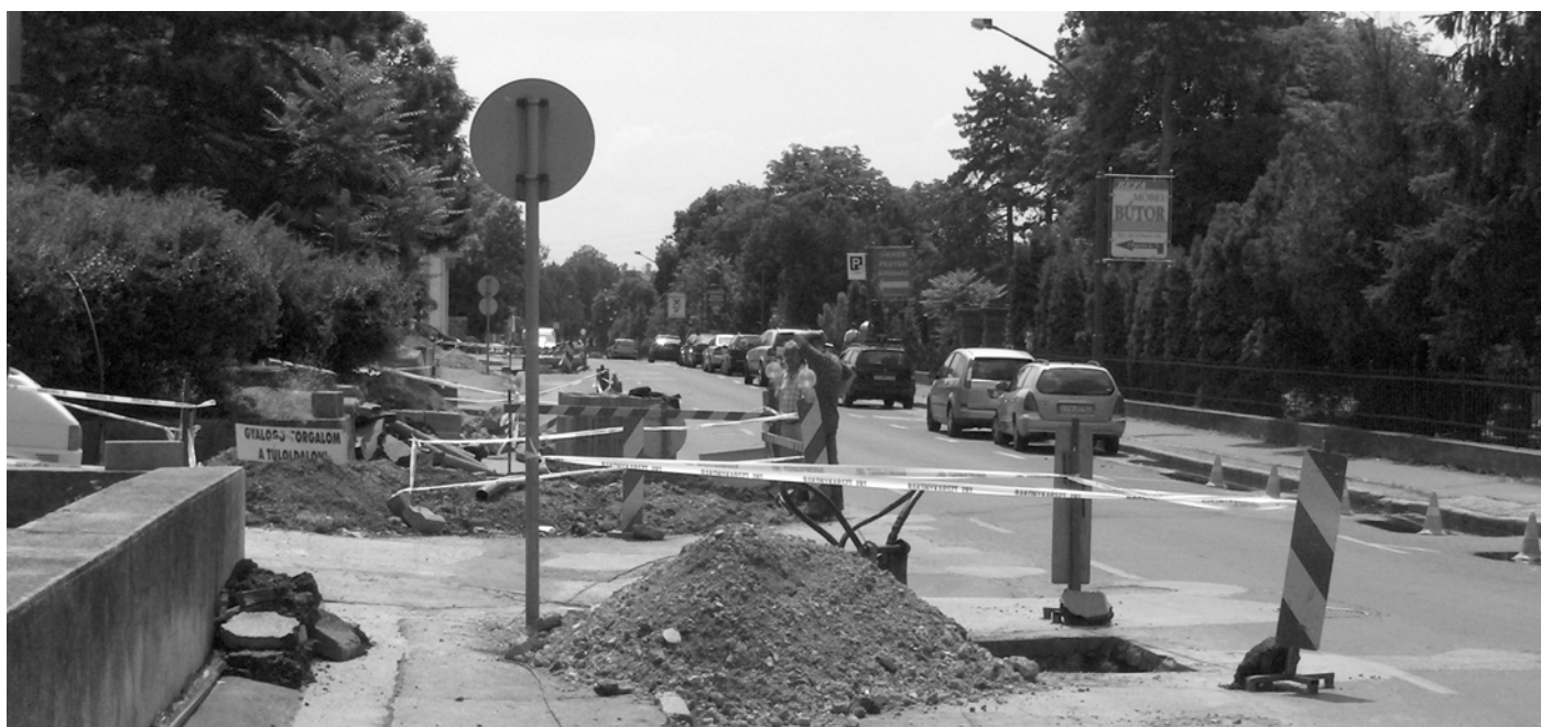
Veszprémben a Mártírok úti ivóvíz vezeték rekonstrukciós munkálataira került sor