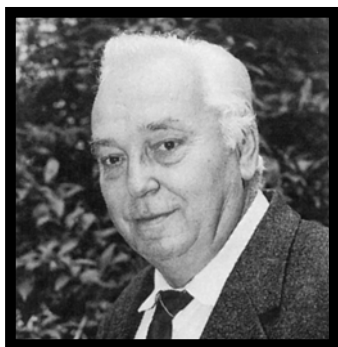
Bendicsek József (1934–2007)

Július 25-én, életének 73. évében elhunyt Bendicsek József, cégünk jogelődje, az 1960-tól 1993-ig működő Veszprém Megyei Víz- és Csatornamű Vállalat egykori igazgatója.