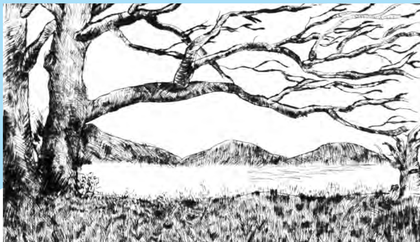
„Folyó partján” Pad Eliza Diána rajza (a Magyarpolányi Alapfokú Művészetoktatási Intézmény 8. osztályos tanulója)